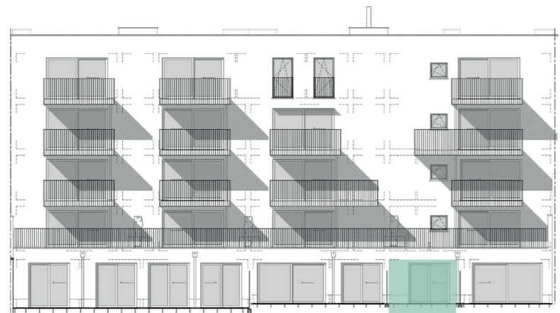
Westgevel / Façade Ouest